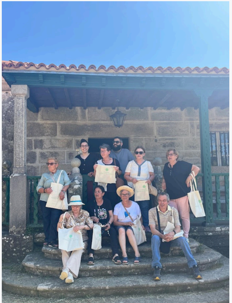
Asistentes y formadores Aldea Dixital

El programa incorporó también una dimensión social y comunitaria, ofreciendo espacios de encuentro y socialización, e incluyó actividades de carácter cultural.