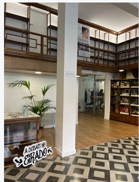
Instalaciones La Moda Rural Lab