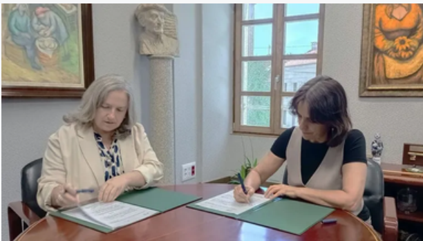
Firma Acuerdo Colaboración Concello Silleda 2024

Para ello se puso en marcha un programa de apoyo a la digitalización dirigido a pequeñas empresas, autónomos y proyectos emprendedores de la comarca, con acciones formativas prácticas en comunicación digital y herramientas online. Esta iniciativa permitió activar el vivero como un espacio útil y cercano al tejido empresarial local, contando con la participación de más de 25 personas y empresas.