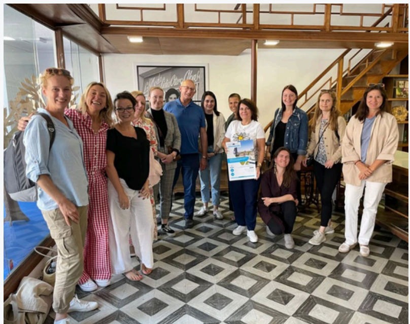
Asistentes PICOBELLO- Interreg Europe en La Moda Rural Lab

Durante la visita, se compartieron las estrategias que la Fundación Roberto Rivas aplica para promover la sostenibilidad, la inclusión y la participación en el medio rural , así como experiencias prácticas y propuestas innovadoras orientadas a afrontar los retos comunes que afectan a los territorios rurales en el conjunto de Europa.