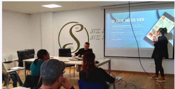
Equipo Maia Comunicación Viveiro Empresas Silleda