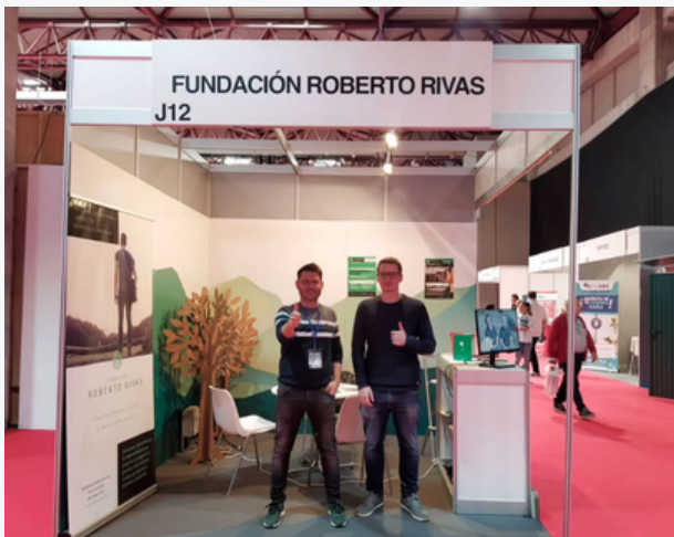
Semana Verde - 2024

Asimismo, la Fundación reforzó su colaboración con Afeiral (Asociación Feira Semana Verde de Galicia) , la Asociación Mulleres da Estrada y la Asociación ECOS de comercio local , contribuyendo a la dinamización económica y social del territorio a través de acciones de apoyo al asociacionismo coordinación y visibilización.