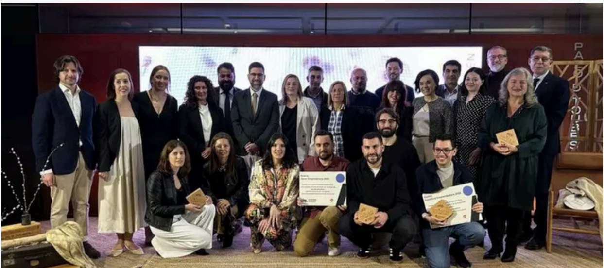
Premiados Premios “Orixe! AJE Ourense

En esta misma edición, se premió también a Xesta Asesoría , proyecto emprendedor apoyado por la Fundación Roberto Rivas, destacando su enfoque innovador y su contribución al fortalecimiento del ecosistema empresarial local. La presencia y reconocimiento de iniciativas como Xesta Asesoría evidencian el impacto real del trabajo de acompañamiento desarrollado por la Fundación y la importancia de tejer alianzas sólidas con proyectos que comparten valores de innovación, compromiso y arraigo territorial.