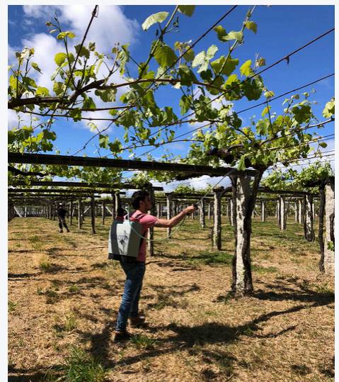
Proceso de elaboración Orixe Salgada