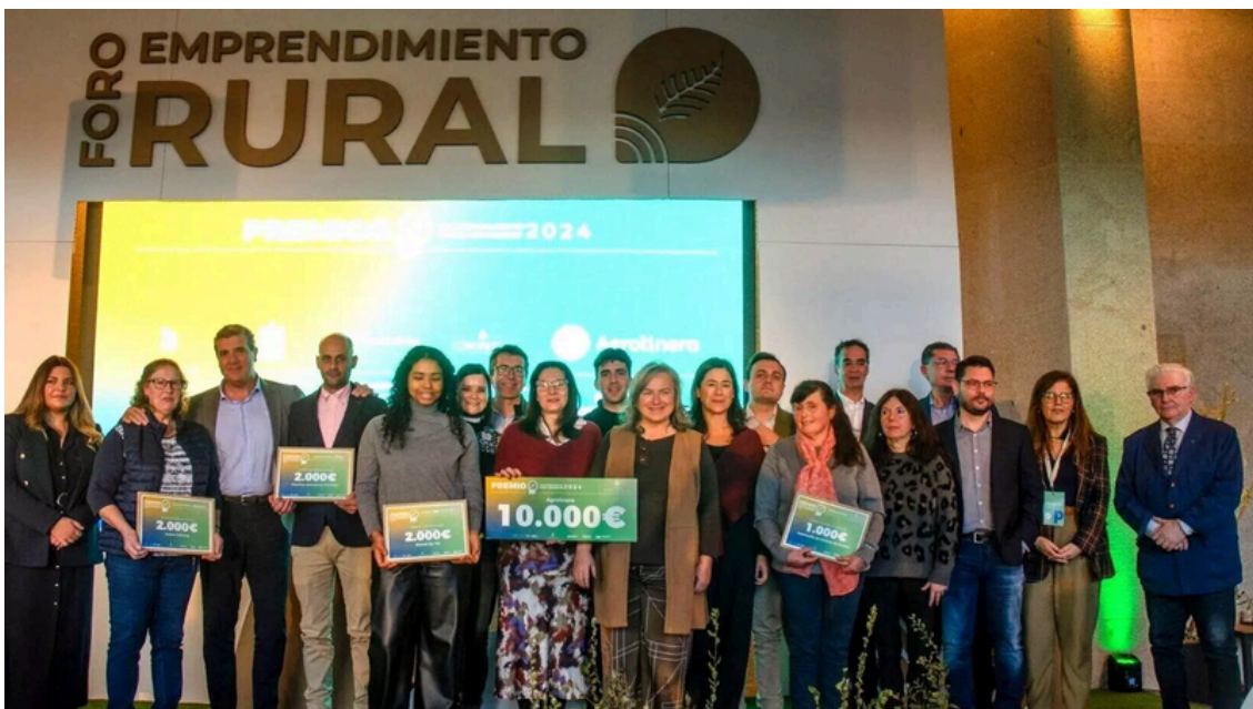
Premios al Emprendimiento Rural Innovador 2024

El premio principal, dotado con 10.000 euros, fue otorgado al proyecto Agrolinera, por su capacidad para generar impacto económico y medioambiental positivo a partir de soluciones innovadoras vinculadas al sector agroganadero. Asimismo, se concedieron distintas menciones especiales a proyectos relevantes por su contribución a la fijación de población, la innovación desde el territorio y el impacto social.