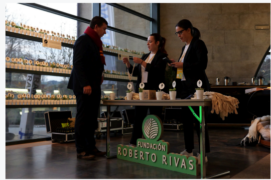
Fotos Varias I Foro Emprendimiento Rural Innovador