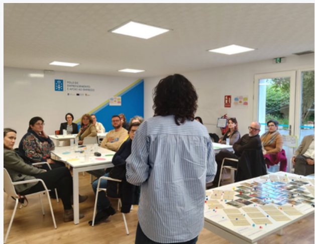
Sesión presentación con Asociación ECOS